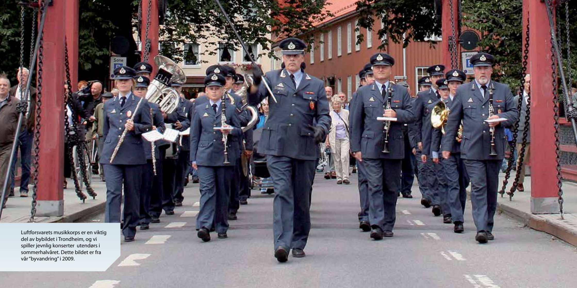
Luftforsvarets musikkorps er en viktig del av bybildet i Trondheim, og vi spiller jevnlig konserter utendørs i sommerhalvåret. Dette bildet er fra vår "byvandring" i 2009.